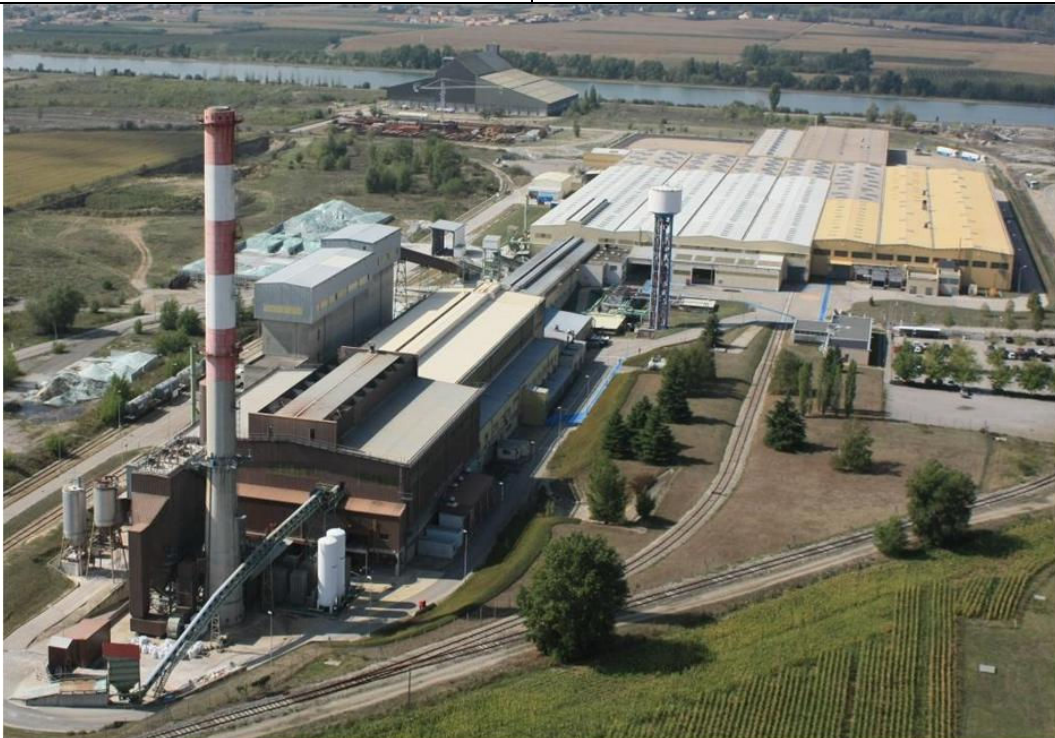
Prise de vue aérienne d'Eurofloat (Eurofloat.jpg)